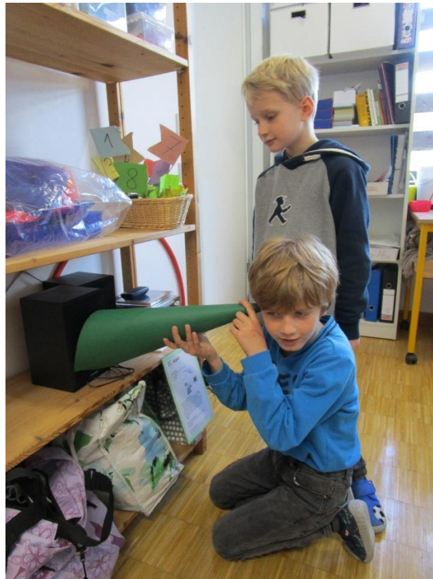
Das gute alte Hörrohr – so kann ich eine ganz leise Geschichte trotzdem hören.