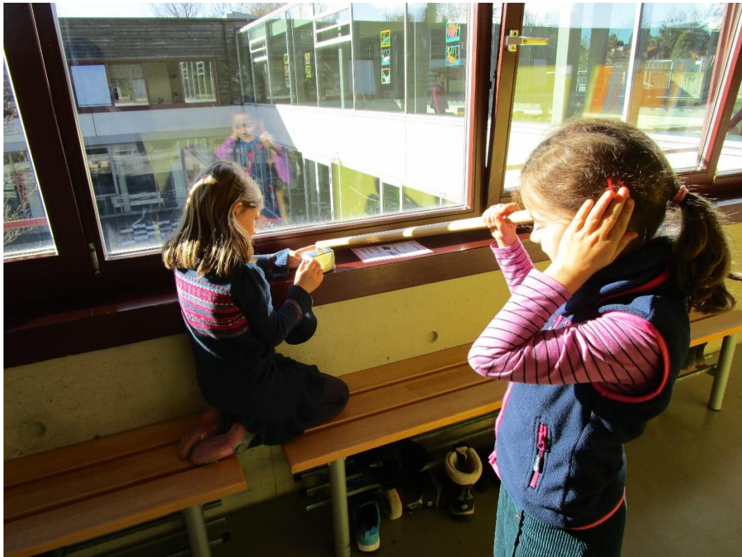
Der laute Wecker – mit dem Holzstab am Ohr würde ich wohl schneller aufwachen.