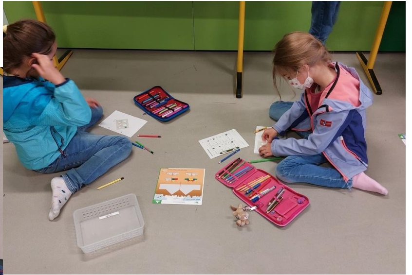
Die Kinder zeichnen mit der Schablone achsensymmetrische Figuren.